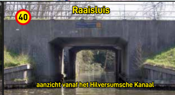
40 Raaisluis aanzicht vanaf het Hilversumsche Kanaal