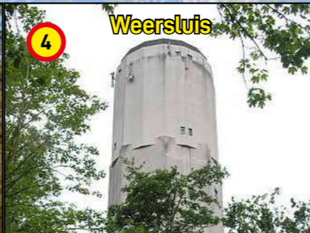
4 Weersluis Watertoren gelegen tegenover Weersluis