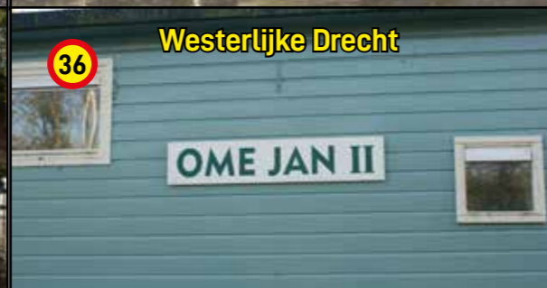
36 Westerlijke Drecht OME JAN II