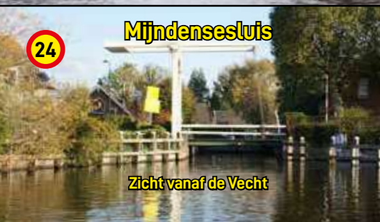
24 Mijndensesluis Zicht vanaf de Vecht