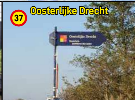
37 Oosterlijke Drecht